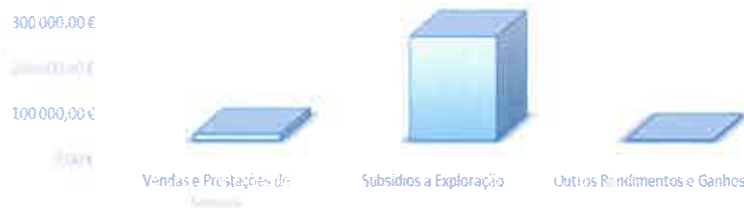
Rendimentos - 2022

*Verificou-se um aumento de cerca de 30,75%, relativamente ao exercício de 2021.